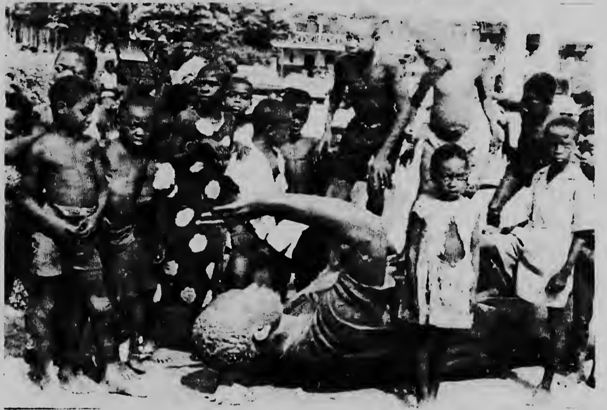
ACCRA--GHANA--Aki nos por mira algun mucha ta hungando riba e estatua di presidente derroca di Ghana Kwame Nkrumah. E estatua tabata den centro di Accra te cu siman pasa prome cu e golpi di estado.

ta-Leninista cu Nkrumah tabata aplica pa economia dje pais. E presidente di conseho nacional di liberacion teniente general Joseph Ankrah a bisa anochi cu libre empresa lo reemplaza na socialismo di estado den republica africana. Di otro banda e ta bisa cu den embahada sovietica nan ta quimando documentonan. Esaqui ser suponi pa motibu dje tantisimo nubianan di huma cu tabata sali foi e edificio aqui i cu den embahada di China Comunista varios camion tabata cargando paquenan manera maleta, valiesnan etc. Ankrah a declara cu estado Ghanaes lo debilbe na empresarionan priva algun compania estatal i cu e gobierno lo ocupe solamente cu e proyectonan fundamental pa e nacion. Nan a apoya competencia na beneficio dje economia nacional" Tam